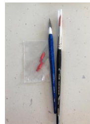
Figure 3 : exemple de trousse à céramique