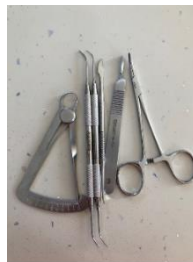
Figure 2 : exemple d'une trousse fixe