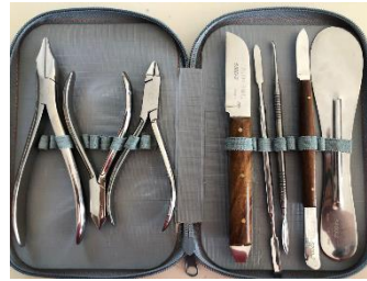
Figure 1 : exemple d'une trousse amovible